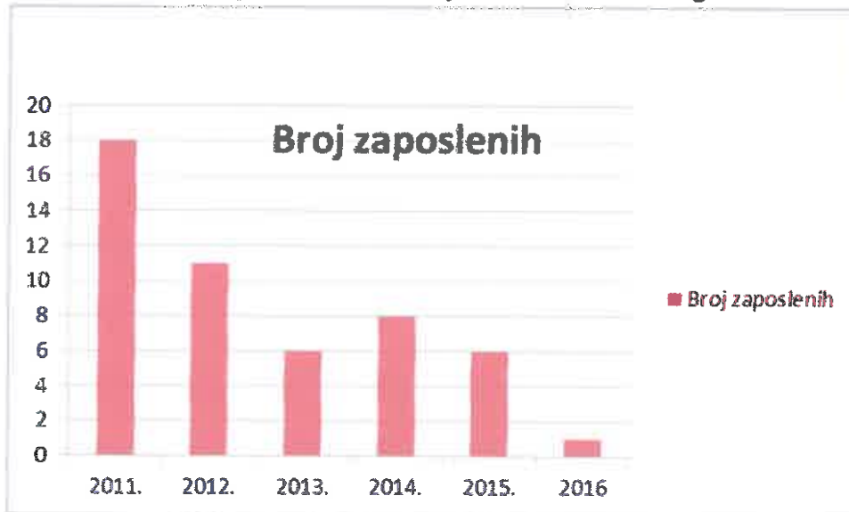
Gravikon 2. Broj zaposlenih u razdoblju od 2011. do 2016. godine